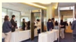
会場入口の保安検査