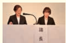
議長団 筑後1-4支部長 筑後2支部長