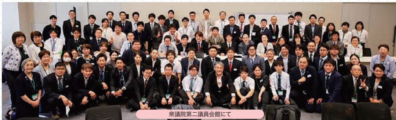
衆議院第二議員会館にて