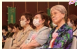
いつも暖かく見守ってくださる 前会長・元、前副会長