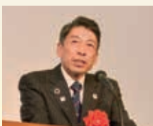
服部誠太郎 福岡県知事