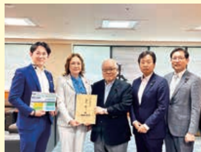
厚労大臣申し入れ