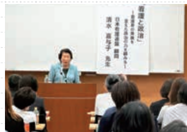
ナースプラザ福岡にて

これからも益々お元気で活躍されますことを祈念いたしております。ありがとうございました。