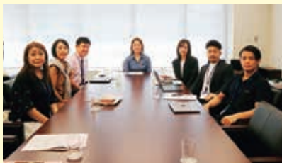
ウェルビ対話集会

残暑の候、健やかに過ごしのことと存じます。福岡県看護連盟の皆様には平素変わらず、看護政策の推進に多大なご貢献を賜り誠にありがとうございます。