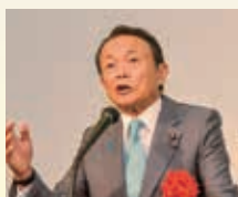
麻生太郎 自民党副総裁