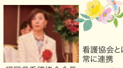
看護協会とは常に連携 福岡県看護協会会長