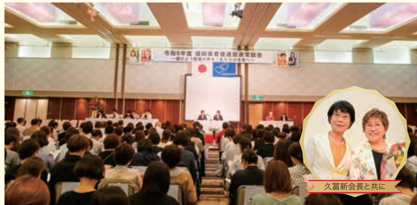
久富新会長と共に