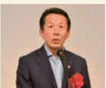
香原勝司 福岡県議会議長