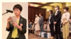
福岡県看護連盟会長表彰受賞者